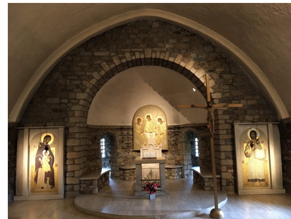
chapelle de l'abbaye

Depuis plus de 40 ans la F.O.O œuvre à tisser et renforcer des liens fraternels entre tous les orthodoxes des différentes juridictions présentes sur notre grand ouest (Normandie, Bretagne, Pays de Loire). Elle organise des rencontres annuelles à caractère spirituel, des pèlerinages aux saints locaux, des sessions de formation au chant liturgique. Elle se veut au service de l'Eglise dans un esprit d'ouverture de dialogue et d'approfondissement de notre tradition orthodoxe.