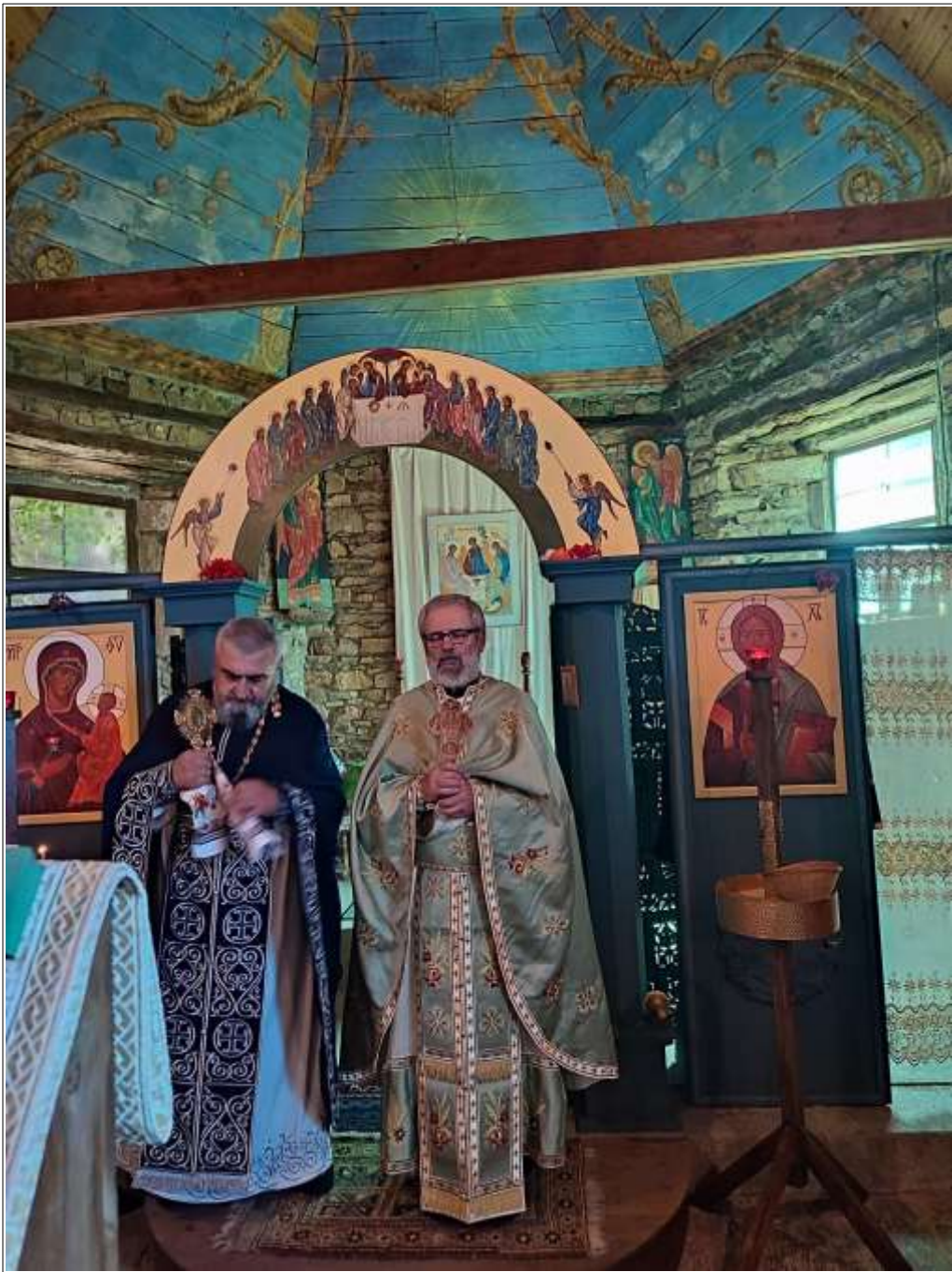
Le samedi 16 juillet au S pulcre   Pl rin-sur-Mer P lerinage 2022 au Menez Br 