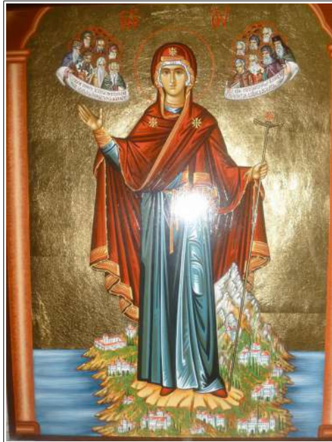
N. D. Du Mont Athos