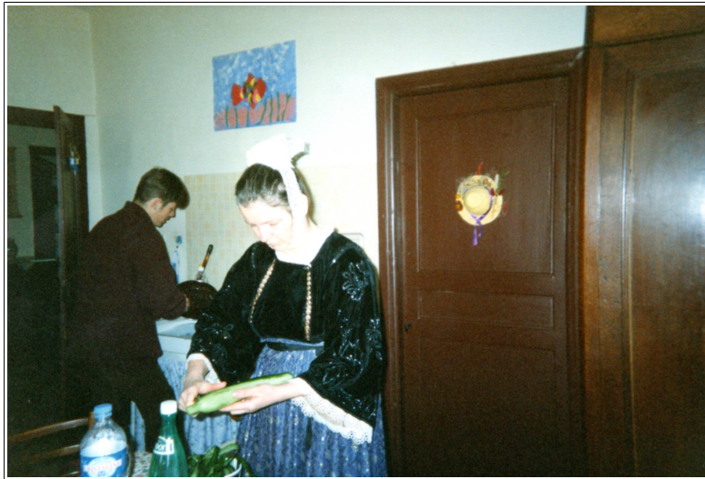
La Demeure de Paix au Vaublanc