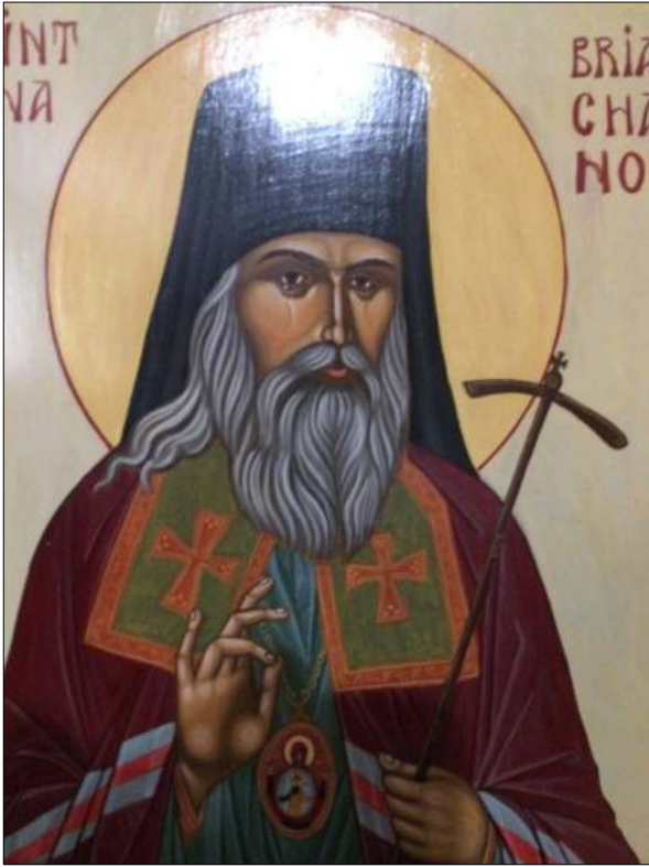
St P. Briantchaninov, peinte, 40/50, 300 Euros