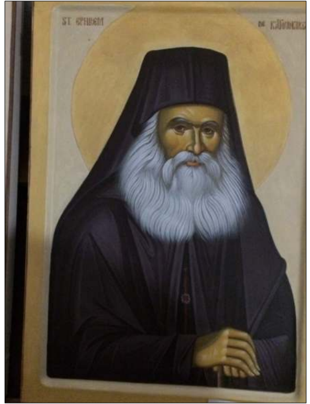
St E. de Katounakia, peinte, 40/50, 300 Euros