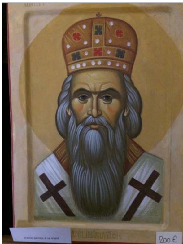
St Jean Vélimirovitch, peinte, 200 euros

Plus petites mais toujours peintes à la main