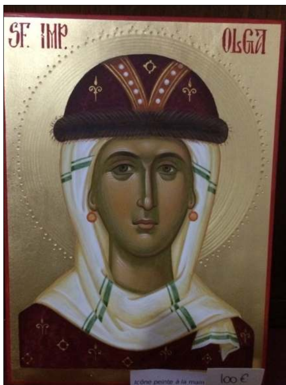
Sainte Olga, peinte, 200 euros