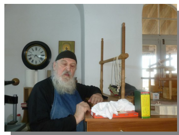
Dans son diaconimat, 2013.